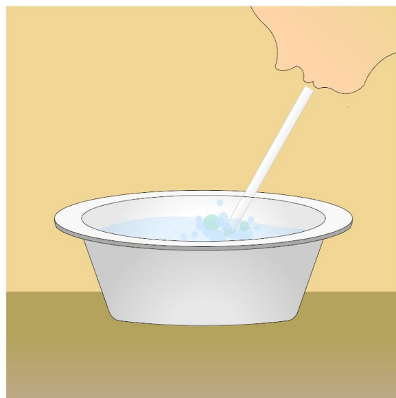
2. Dmuchał przez słomkę tak, aby na wodzie powstały kręgi i bąbelki.

Grafikę do ćwiczenia z wodą wykonała Joanna Kępa