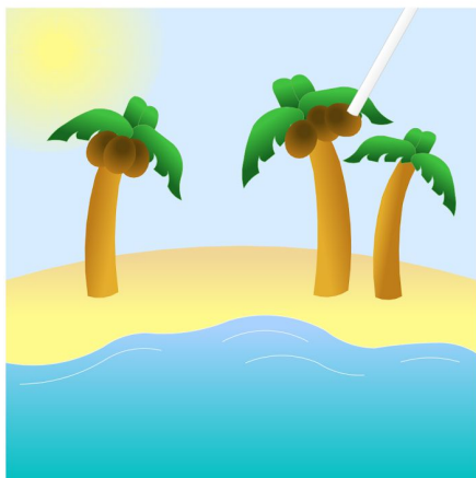
3. Wciągając powietrze przez słomkę, przenieś orzechy kokosowe na palmy.