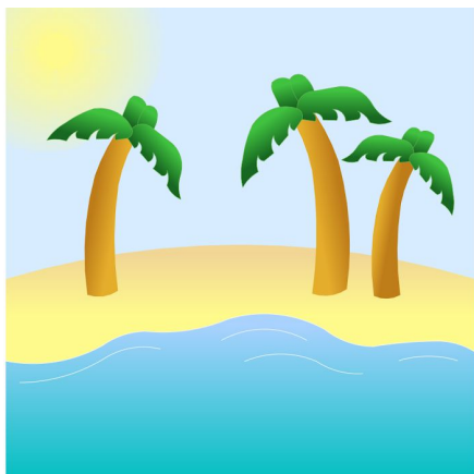
1. Narysuj wyspę, na której rosną palmy kokosowe.