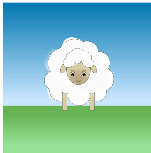
4. Gotowe! Możesz nakleić watki i zrobić z planszy dekorację świąteczną.