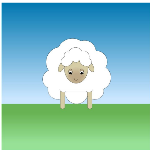
1. Narysuj baranka.